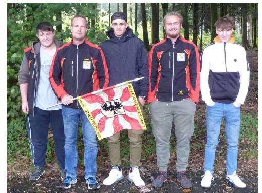
U21, 8. Rang mit 708 Punkten.

Am 17. September fand die Eidg. Gruppenmeisterschaft in Emmen statt. Unsere U21 Gruppe war bei gesamt-schweizerisch Qualifikationsrangliste auf dem erwartungsvollen ersten Rang. Dies half uns aber herzlich wenig, es starteten alle wieder bei 0 Punkten. Es wurden 2 Durchgänge geschossen, das Maximum ist 800 Punkte. Mit 708 Punkte knackten wir die 700er Marke erneut und klassierten uns auf dem hervorragendem 8. Platz und damit beste Sektion aus dem Kanton BL. Dies ist ein erneuter Rekord seit ich im Amt bin.