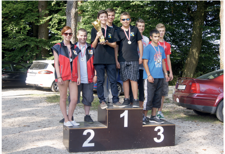
Die Junioren-Siegergruppen (v.l.n.r.): SG Ziefen, Militärschützen Allschwil und Laufen I.

So wie diesem Mädchen ist es vielen Jungschützen und Junioren an diesem