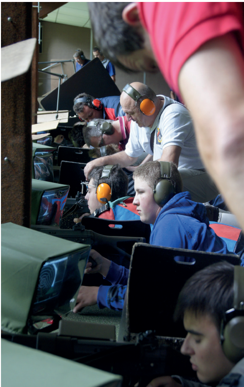
Letzte Instruktionen und Einstellungen vor dem Start.