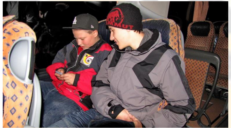
Bus zur Schiessanlage Thun / Guntelsey. Was gibt's Neues?