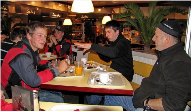
Beim gemeinsamen Morgenessen in Münsingen und im.....