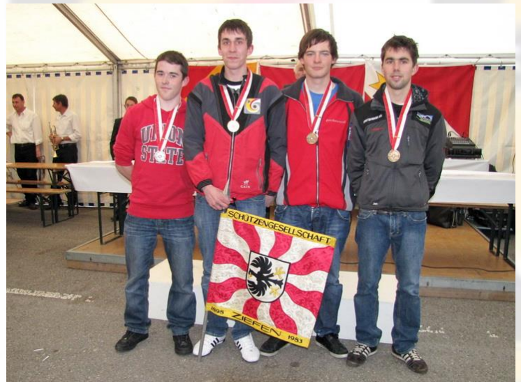
Die Siegerehrung, ein high light zum Saison-Abschluss 2010