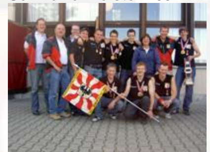
Jungs, wir sind stolz auf euch!

Durchgang schiessen, steht die Juniorengruppe nach dem ersten Durchgang mit sensationellen 271 Punkten im Zwischenklassement auf Rang zwei hinter Prato und punktgleich mit der SG Morgarten Jetzt erst einmal Pause machen und die Konzentration auf den um 10.50 Uhr stattfindenden zweiten Durchgang richten. Die Jungschützen können sich im 2. Durchgang steigern und erreichen mit dem annehmbaren Gesamtergebnis von 703 Punkten den 35. Schlussrang , n.b. als beste der Baselbieter Gruppen. Und was machen die Junioren. Es läuft nicht mehr so gut wie beim 1. Durchgang, das Gruppenresultat liegt vier Punkte tiefer. Wie haben die Konkurrenten geschossen? Gespannte Nervosität. Ein Rang unter den besten sechs Gruppen sollte – wie im letzten Jahr bei den Jungschützen – doch drinliegen!? Nach langen Minuten des Wartens und Starrens auf die elektronische Rangliste ist es endlich soweit, der Name SG Ziefen erscheint auf der Anzeigetafel an erster Stelle. Das Gesamttotal von 538 Punkten hat gereicht; wir sind Schweizermeister 2007!