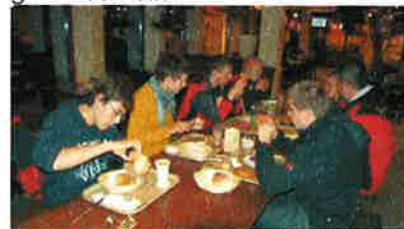
Beim Morgenessen um 06.00 Uhr im Mövenpick in Würenlos. Es scheint zu schmecken.

Wie bei früheren Finalteilnahmen besammelten wir uns um 05.00 Uhr beim Gemeindehaus, denn wir müssen die erste Runde bereits um 08.00 Uhr schießen. Es kann losgehen Wir fahren mit einem Bus der Garage Schlumpf AG Richtung Zürich. Von 06.00 Uhr bis 06.45 Uhr nehmen wir im Autobahnrestaurant Mövenpick in Würenlos wie gewohnt das Morgenessen ein.